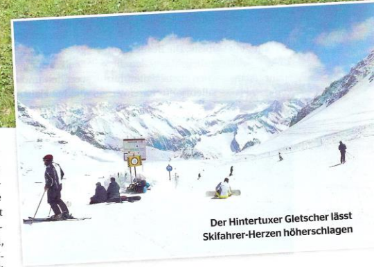
Der Hintertuxer Gletscher lässt Skifahrer-Hezen höherschlagen