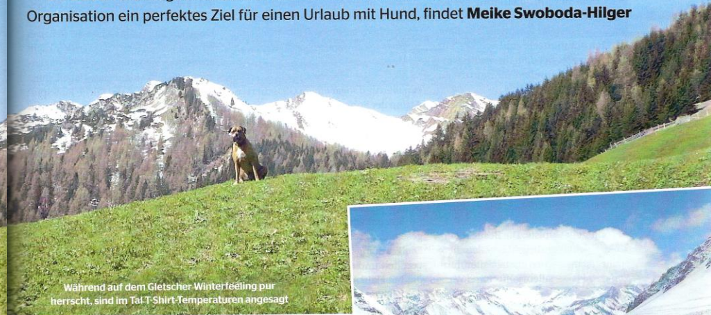
Während auf dem Gletscher Winterzeitung pur herrscht, sind im Tal T-Shirt-Temperaturen angesagt

Der Hintertuxer Gletscher ist ganzjährig geöffnet und bietet auch außerhalb der Ski-Saison die Möglichkeit, die Bretter unter die Füße zu schnallen. Mit ein bisschen Organisation ein perfektes Ziel für einen Urlaub mit Hund, findet Meike Swoboda-Hilger