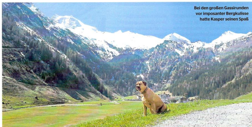
Bei den großen Gassirunden vor imposanter Bergkulisse hatte Kasper seinen Spaß